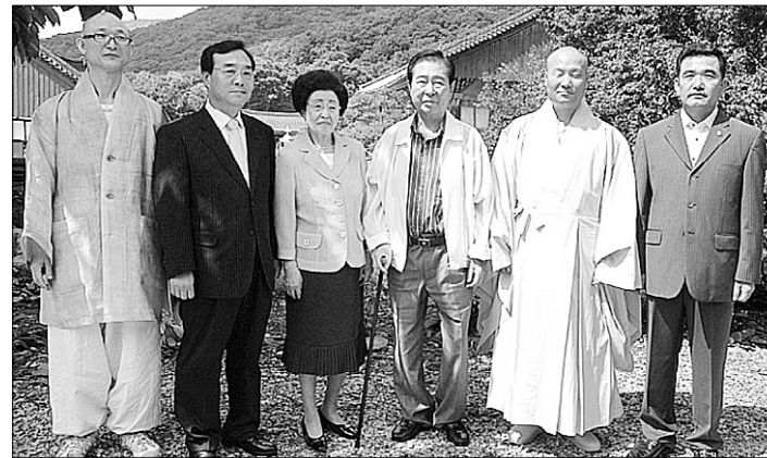
지난해 8월 고창 선운사를 방문한 김대중 前 대통령 내외. 오른쪽은 선운사 주지 법만 스님.

8월 18일 서거한 김대중 前 대통령은 임기 중 불교를 전통문화의 관점에서 최대한 지원하는 정책을 추진하는 등 불교 발전에도 많은 기여를 했다는 것이 대체적인 여론이다. 김 前 대통령은 가톨릭 신도였지만, 어떤 정치인 보다도 불교에 대한 관심과 이해로 노무현 대통령과 마찬가지로 불교계와 친밀한 관계를 맺어왔다.