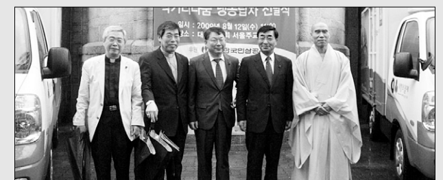
먹거리나눔기운동협의회는 한국인삼공사로부터 음식을 운반할 수 있는 냉동차를 전달받았다.

국내최대의 민간 먹거리나눔 운동기구인 먹거리나눔기운동협의회(공동대표 대오, 김재열, 배태진, 김경림·이하 협의회)가 한국인삼공사로부터 사랑의 냉동탑차를 지원 받았다. 한국인삼공사(사장 전상태)는 임직원들이 심시일반으로 모은 금액 1억 500만원으로 1톤급 냉동차량 5대를 구입, 협의회에 전달했다. 전달식은 8월 12일