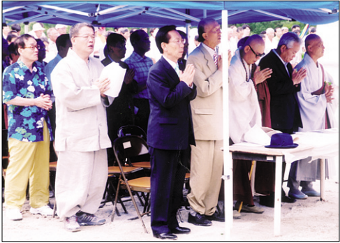
상주 용해사 대웅전 및 7층석탑 봉안법회.