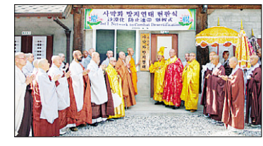
사막화방지를 막기 위해 연대를 구성한 스님들

포천 국제정맥선원(대표 대원 문재현) 선사는 8월 11일 선원 내에서 해외 및 국내 사막화방지 활동을 막기위 한 스님 연대모임 '사막화방지연대'를 결성했다.