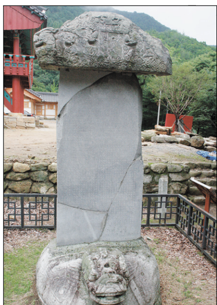
조각을 이어 맞춘 진공대사보법탑비와 적광전 앞의 석탑. 비로사 지표조사에서 발굴해 낸 석재들.

그 내용을 보면 고승이 후학을 아끼는 마음이 얼마나 간절한지 한눈에 알 수 있습니다. 마침, 하안거 해제일이 지나고 운수들이 만행을 떠난 시간입니다. 진공 대사의 유언을 읽으며 가장 먼저 느끼는 것은 마음 뒤는 사람이 견지해야 할 덕목은 시간과 공간을 떠나 있다는 것입니다. '가는 곳마다 수행에만 전념하라' '평범한 진리를 따르도록 하라' '옳지 않은 일