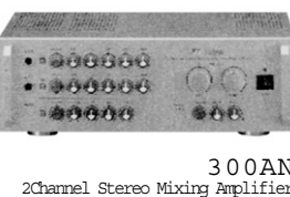
300AN 2Channel Stereo Mixing Amplifier