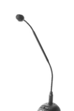
▶고성능 탁상 마이크 ◊ 가격 : 135,000원 (택배비 포함)