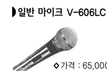
▶일반 마이크 V-606LC

◆특징 : 자체 제작하는 스피커로 소리가 웅장합니다. 핀 마이크와 잘 맞습니다. ◊ 가격 : 500,000원 (설치비 포함)