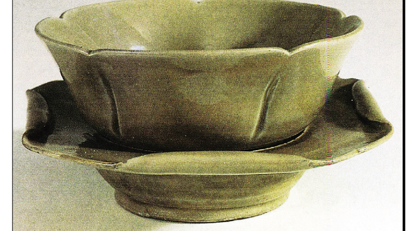
‘청자화형탁잔(靑磁花形托盞)’ 중국 영파시박물관 소장.

武가 지은 <일지록(日知錄)>에는 ‘진(晉)나라가 촉(蜀)나라를 멸망시킨 후, 촉의 영향으로 차를 마시는 풍습이 확산됐다’라는 기록이 있어, 이 시기에 차 문화가 활약유역으로 확산됐음을 알려준다. 또한 <남제서(南齊書)>의 기록에 따르면 제사 때에 살아 있는 동물을 대신해 떡, 차, 술을 바치도록 하는 제도가 생긴 것으로 보아 당시 차가 귀족문화의 발달과 함께 고급문화로 인식되기 시작한 것을 알 수 있다. 따라서 위진남북조시대는 차에 있어서 문화적 기틀이 형성되기 시작한 때이며 이후 수준 높은 당·송대의 차 문화를 예고하는 시기인 것이다. 두육이 ‘천부’를 쓴 시기가 바로 이 무렵이다.