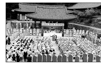
해인사 도각 스님 영결·다비식이 8월 4일 해인총림장으로 봉행됐다.

합천 해인사 도각 스님(前 조계종 중앙총회의원)의 영결식과 다비식이 8월 4일 해인사에서 해인총림장으로 봉행됐다.