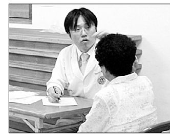
동국대 경주캠퍼스의 하계의료봉사 장면.

동국대 경주캠퍼스(총장 손동진)는 8월 5~9일 경북 영덕군 창수면 신리 일원에서 하계의료봉사를 실시했다.