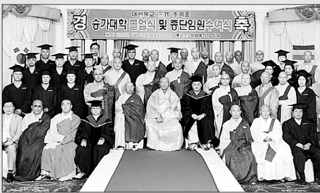
7월 28일 열린 삼보조계종 승가대학 제1기 졸업식 및 임원 임명장 수여식.

대한불교삼보조계종(총무원장 법장은 7월 28일 김해 목화예식장에서 '제1기 승가대학 졸업식 및 종단임원 임명장수여식'을 봉행했다.