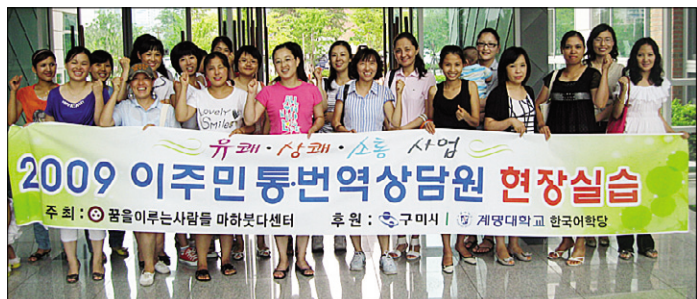
7월 22일 꿈을이루는사람들이 주최한 이주민 통번역상담원 양성교육을 마친 이주 외국인들.

구미 꿈을이루는사람들(대표 진 오민)은 7월 21~22일 ‘유쾌·상쾌·소통 이주민 통번역상담원 양성교육’ 현장실습을 실시했다.