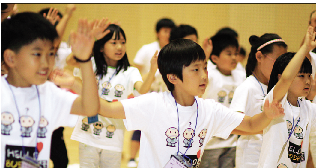
‘2009 연꽃 어린이 연합캠프’ 성료