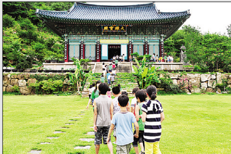
영평사 대웅전을 참배하는 천진불들.

어린이 숲속학교에서는 자원봉사자로 참가한 대학생과 고등학생 30여 명이 교사로 참여해 ‘여