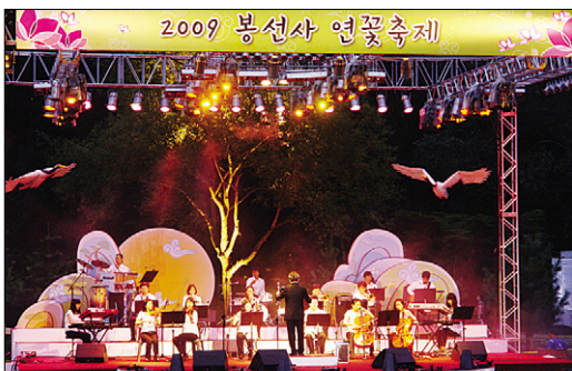
봉선사 연꽃축제 공연 모습.

깊은 연관을 맺고 있다”며 “연꽃축제를 통해 생활수준 만큼 문화적인 정서를 함양하는 계기를 갖자”고 당부했다.