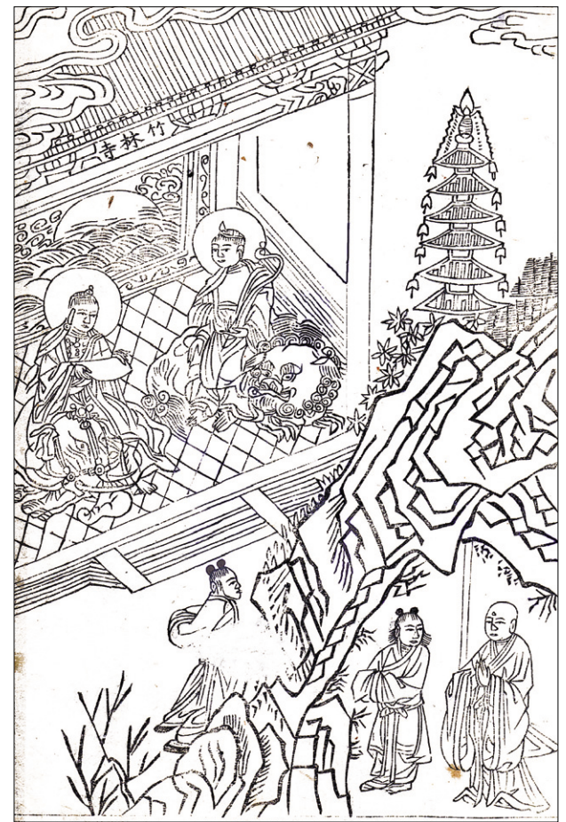
고려시대 문수보살도(文殊菩薩圖) 판화(半部) 27.2×18.0cm

<석씨원류>에 등장하는 이 삽화는 당나라 때 국사 법조 스님이 오대산에 이르러 푸른 옷을 입은 선재동자와 난타라고 칭하는 두 동자의 인도로 석문으로 들어가 죽림사라고 붙여있는 전각에서 문수·보현보살을 진건하고 문수보살에게 법을 묻는 장면을 판각한 작품이다. 법조(法照) 스님은 당나라 때 스님으로 현산에 들어가 승원을 섬기며 미타대 반주도량에서 정업을 닦고 766년(대력1) 4월 장안 장경사 정도원에서 오회법사찬(五會法事讚)을 지었다. 대력 4년 행주 호동사의 고건대에 오회염불도량을 차렸으며, 오대산 대성 죽림사에 가서 문수·보현을 진건하고 염불하는 법을 받았다. 뒤에 화엄사 화엄원에서 염불도량에 들어가 죽림사기(竹林寺記)를 지었으며, 먼저 문수·보현의 설법을 받던 곳에 절을 짓고 죽림사라 이름 했다. 이때에 당나라 대종(代宗) 황제가 스님의 덕화에 깊이 귀의하고 궁중에서 오회염불을 수행케 해, 오회염불이 조야에 크게 행할 때 이에 세상에서 그를 일컬어 오회 법사라 했다. 시호는 대오(大悟), 저서는 오회법사의 3권, 오회법사찬 등이 있다. 본문을 살펴보면 "법조 스님은 문수·보현보살 앞에서 예배를 드리고 물었다. '말세의 법부는 어떤 법문을 뒤야 하는지 모르겠습니다.' '모든 수행하는 법문 가운데 염불보다 더 좋은 법문은 없다. 아미타불의 원력은 생각하기조차 어렵다. 너는 마땅히 염원을 아미타불에 매어두고 결정코 정토왕생을 취해야 할 것이다.' 이때 두 보살이 함께 팔을 펴서 정수리를 쓰다듬고 그에게 기별을 주었다. 너는 염불의 힘으로 궁극에 가서