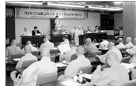
7월 24일 열린 태고종 제2차 종책토론회.