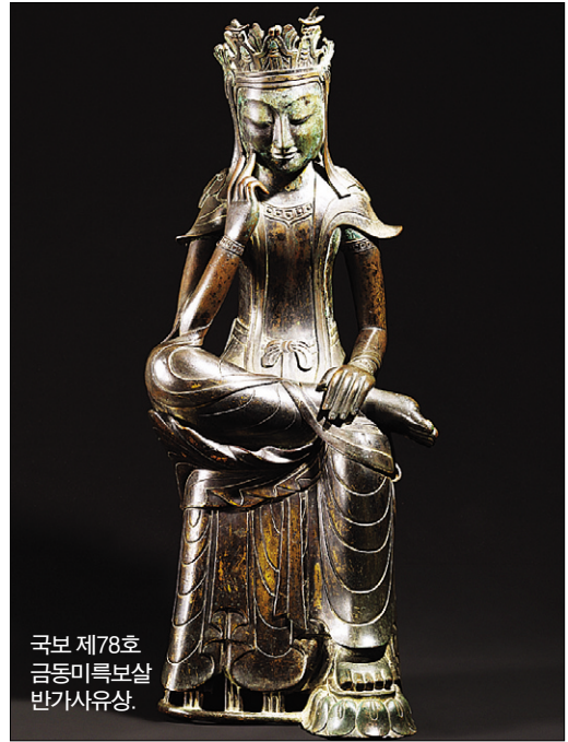
국보 제78호 금동미륵보살 반가사유상.

한편, 미륵반가상과 함께 최고 불상으로 꼽히는 국보 83호 금동미륵보살반가사유상은 지난해 벨기에 브뤼셀 보자르예술센터에 전시된 바 있다. 김성우 기자