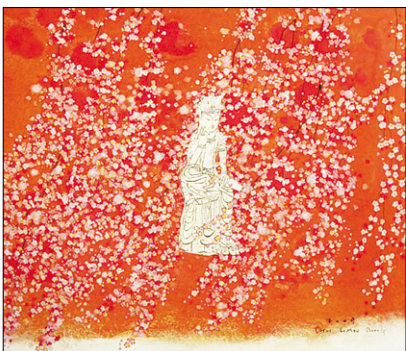
최한동 작 '어찌지 봄바람'.

그림시장 호황이었던 2007년 전후로 인기를 끌었던 100만원대 소품전이 다시 등장해 눈길을 끈다. 한국미술센터(관장 이일영) 주관으로 7월 29일~8월 11일 인사동 갤러리 이즈 1, 2, 3층 전관에서 열리는 '작은 것이 아름답다' 전에는 4호에서 6호 크기의 소품 300여 점이 출품된다. 가격은 100만원대가 주종이며 가장 비싼 작품이 300만원이다. 참여 작가는 이종상 이인실 이철주 원문자 전래식 등 원로 중진에서 청년작가까지 187명에 이른다. 장르도 한국화(95명), 서양화(80명), 민화·문인화·한글서예(12명) 등을 망라한다.