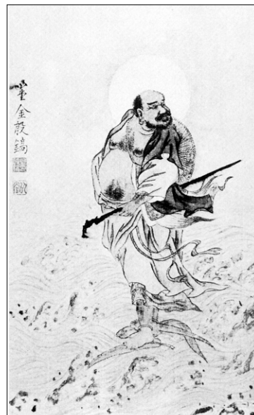
이담 김은호의 '달마 도강도(渡江圖)' (간송미술관 소장).