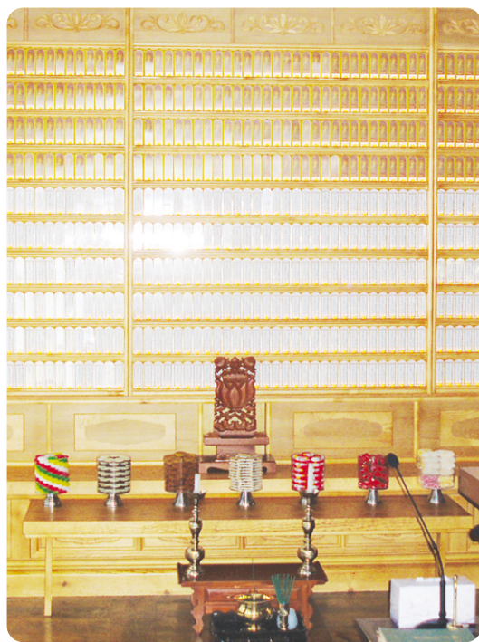
용학사 극락전 영구위패

찬덕연등에서는 KS케이블을 사용하여 가장 안전하게 전문 기술인에 의해 직접 감독 시공합니다.