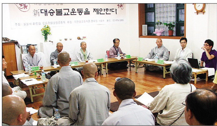
7월 3일 서울 인드라마생명공동체 교육관에서 열린 제11차 화엄광장 모습.