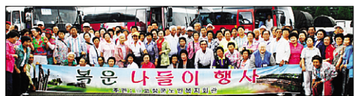
고창노인복지관이 7월 7일 가진 어른신 나들이 행사.

장맛비가 이어지는 가운데에도 어른신들은 대나무의 숲결이 살아있는 죽녹원의 대나무박물관에서 죽향의 신선함을 몸소 느꼈고 여수 오동도 해양박물관을 방문해 자원봉사자들과 함께 사진촬영을 하는