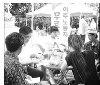
꿈을이루는사람들의 이주노동자 상담 모습

한편, 한국의 인도네시아 이주노동자는 약 2400명으로 구미시에는 650여 명이 산업현장에서 일하고 있다. 꿈을이루는사람들은 구미시