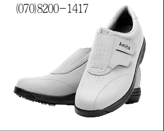
능의 액션 누백소재, 산악지대에서 미끄러지지 않는 등산화 바닥 구조, 비나 눈 때를 대비한 특수 돌기구조에 의한 미끄럼 방지기능 등이 탁월하고 내마모성 또한 강하다. (070)8200-1417

인체공학 특성 고려해 디자인된 이 신발은 특수공학 스프링을 신발에 접목시켜 오랫동안 걸어도 발이 피곤하지 않으며, 통풍성이 뛰어나 쾌적한 상태를 유지해 준다. 특히 무릎보호와 척추보호에 효과를 가진 설계와 최첨단 신소재, 방수기