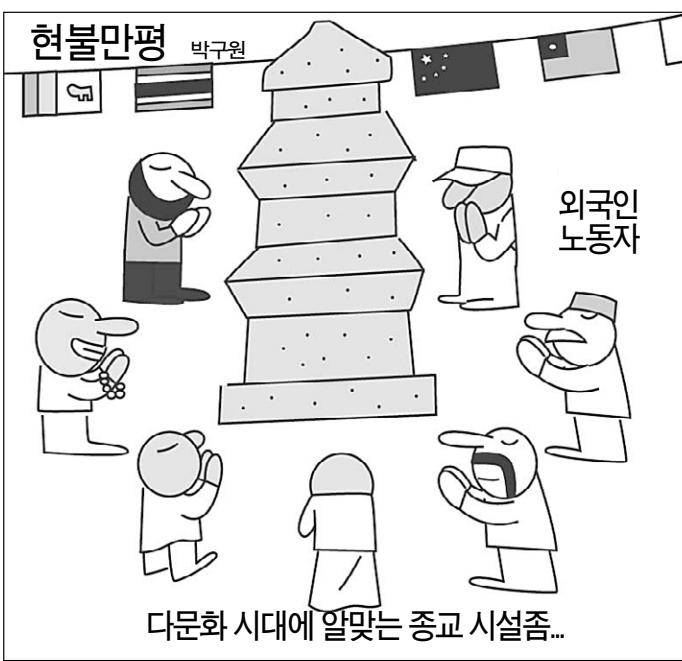
다문화 시대에 알맞는 종교 시설...