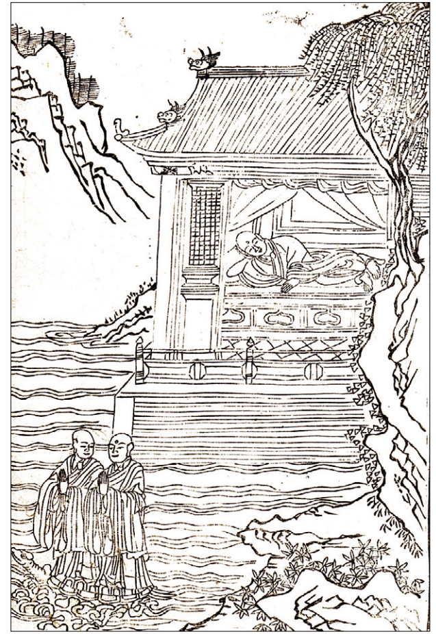
고려판희천몽구(高麗版希遷夢龜圖) 판화(木版) 1673년 간행(刊行) 반곡(半郭) 27.2×18.0cm

〈석씨원류〉에 등장하는 이 삽화는 당나라 때의 스님인 희천이 육조대사와 같이 한 마리의 거북의 등에 올라타고 깊은 못을 헤엄치는 꿈을 꾸고 있는 장면을 판각한 작품이다. 희천(希遷:700-790) 스님은 속성은 진 씨이며, 광동성 단주출신으로 조계에 이르러 육조 혜능에게 득도했으나, 혜능 스님이 입적하자 정원행사 스님에게 배우고 인가를 받았으며, 형산(衡山)의 남사(南寺)에 가서 동쪽의 석상(石上)에 암자를 짓고 형상 좌선했으며 석두 화상(石頭和尚)이라고 불렸다. 광덕 2년(764) 문인들의 청에 응해 중풍을 선양했으며, 약산유엄(藥山惟嚴)에게 법을 부촉하고 정원 6년(790) 세수 91세로 입적했다. 저서에 〈참동계(參同契)〉 <초암가(草庵歌)〉가 있으며, 그의 사상은 조동종(曹洞宗)의 시초가 된다. 본문의 내용을 보면 "어느 날 홀연히 꿈에 육조대사와 같이 한 마리의 거북의 등에 올라타고 깊은 못에서 헤엄치는 꿈을 꾸었다. 꿈을 깨고 나서 이를 점치기를 '거북은 신령한 동물이니 지혜를 상징하는 것이고 못은 자성의 바다를 상징하는 것이다. 나와 스승이 신령한 지혜위에 올라타고 자성의 바다에 노닐지 오래다'라고 하고 마침내 형산의 남사를 찾아갔다. 이 절의 동쪽에 바위가 있었는데 형상이 대와 같았다. 그는 마침내 그 바위 위에 암자를 짓고 그곳에 주석했다. 상당법어에서 말하기를 '나의 법문은 선대의 부처님에게서 전수받은 것이다. 나는 선정 정진을 논하지 않고 오직 부처님의 지견에 도달하는 것을 목표로 삼는다. 마음이 곧 부처다. 부처와 중생, 보리와 번뇌는 이름은 달라도