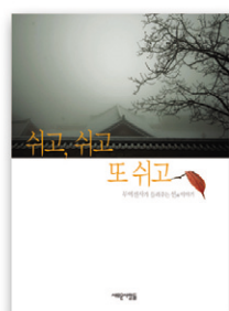
무여선사지음 본문308쪽 정장제책 장가3,000원

스님은 우리들에게 이른다. "소풍을 떠나듯 설레는 마음으로 화두를 챙기되 고요히 쉬어라!" 하루 하루 연속되는 복잡한 일상에서 쉬고, 쉬고 또 쉬어가면 머지않아 진정한 행복에 이른다. 우리들은 이보다 더 행복할 수 없다. 우리들은 이보다 더 평화로울 수 없다.