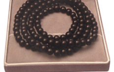
흑단목 108염주, 단주 흑단목염주 / 흑단목염주 크기: 8mm x 10mm x 12mm 55,000원 10mm x 10mm x 12mm 65,000원 12mm x 10mm x 12mm 85,000원 흑단목염주는 가격이 저렴하여 보시용으로 많이 사용됩니다.