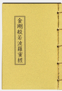
실물크기(소) 3.5 x 5cm (중) 5 x 7cm