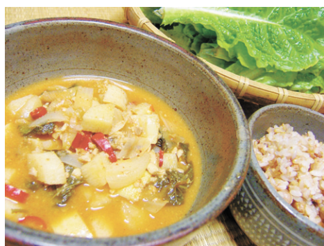
정성이 담긴 웰빙 된장찌개와 메주콩이 듬뿍 들어간 콩밥