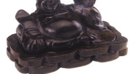
흑단목염주 포대화상항로 (대) 26 x 16 x 16cm 120,000원 (중) 20 x 16 x 16cm 100,000원 (소) 16 x 16 x 16cm 80,000원 예술작품으로 보는 것만으로도 마음이 편안해지고 있는 사람과 나눌 수 있는 미덕과 복덕을 마음껏 이루어 주며 입에서 향이 뿜어져 나와 예술품에도 사용됩니다.

부처님께서 즐겨 사용하시던 흑단목은 지구상에 존재하는 나무중 유일하게 기가 발산되고 최고로 단단하며 자연 문헌이 온존하여 아름다우며 동남아 국가에서 소량만 생산되는 나무중 최고의 명품인 흑단목입니다. ◆문의전화 02-722-1850 입금계좌: 농협 053-12-125418 김환영