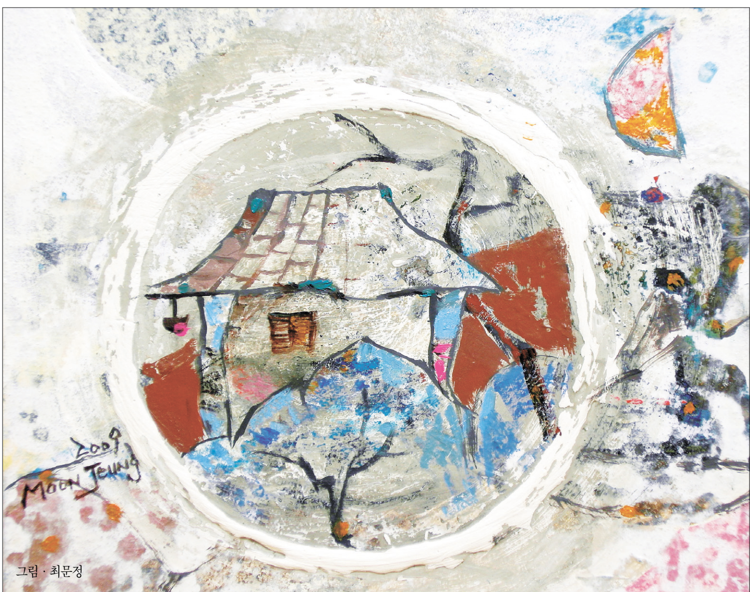
그림 · 최문정

속으로 '이보다 더 간소한 식탁은 없을 것이다'라고 생각했다. 스님이 작년 겨울에 담갔다는 배추김치 한 사발과 국수 세 그릇이 전부였다. '해암 큰스님도 이곳에서 이 스님처럼 살았으리라.' 국수를 단숨에 넘기고 나서 그런 스님에 잠겨 있는데, 스님이 다시 방으로 들어가 정진하려는 듯 작별하자고 눈인사를 했다. "아쉽습니다. 며칠 전에 오셨어도 하얗게 만개한 별꽃을 보셨을 텐데." <계속>