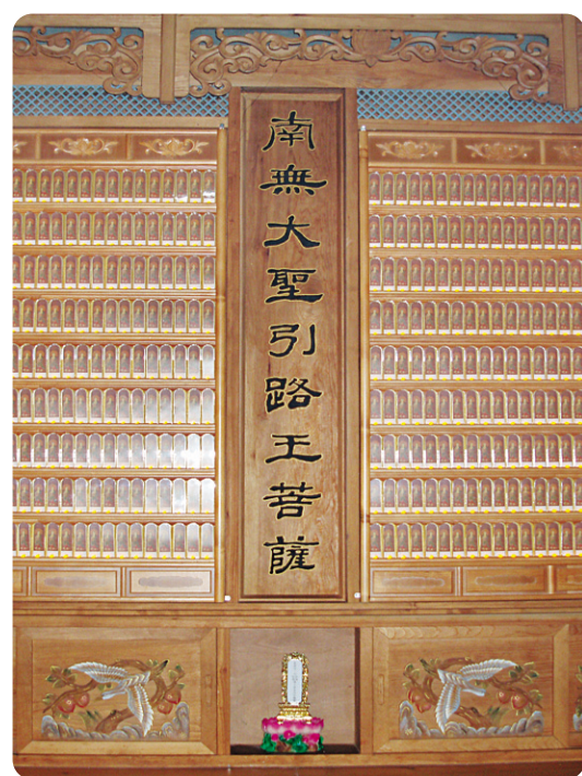
천안 동심사 영구위패

찬덕연등에서는 KS케이블을 사용하여 가장 안전하게 전문 기술인에 의해 직접 감독 시공합니다.