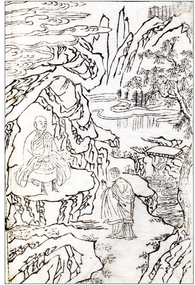
고려판 화엄경(華嚴經) 권제10 신회(神會) 남방(南參) 판화(牛印) 27.2x18.0cm

<석씨원류>에 등장하는 이 삽화는 신희 스님이 조계산에 올라 육조 혜능 스님으로부터 법을 이어 받는 장면으로 조계산의 아름다운 풍광과 혜능 스님이 바위굴에서 사미인 신희 스님을 제접하는 모습을 사실적으로 표현하고 있다. 하택 신희(荷澤 神會) 스님(684~758)은 당나라 양양(襄陽)인으로 속성은 고(高)씨이다. 국장사 호원 법사에게 출가했으나 14세 때 사미의 신분으로 혜능 스님을 찾아가 법을 이어 받은 후, 북종선의 배경에 주력하며 남종선의 확립에 크게 기여했다. 스님은 개원 20년(732) 정월 15일 황대(滄臺) 대운사(大雲寺)의 무차대회(無遮大會)에서, 남종선(南宗禪)의 정통성을 주장하며, 북종선(北宗禪)을 대표하는 승원 법사(崇遠法師)와 정통논쟁을 벌인다. 이러한 신희스님의 노력으로 북쪽의 신수와 남쪽의 혜능의 종파적 분리현상이 나타나기 시작했으며, 신수의 북종선(北宗禪)과 혜능의 남종선(南宗禪)이라는 명칭이 널리 쓰이게 됐다. "혜능 선사가 신희 스님에게 물었다. '어느 곳에서 왔는가?' '온 곳이 없습니다.' '너는 돌아가지 않겠는가?' '한 곳도 돌아갈 곳이 없습니다.' '너는 너무도 망망하구나.' '몸의 인연이 길에 있습니다.' '스스로 이르지 못한 곳이 있기 때문이다.' '지금도 이미 이르렀습니다만 또한 체류할 곳이 없습니다.' 그래서 그는 몇 해 동안 조계산에 머물다가 그 후 두루 이름난 고적지를 찾아보고 이어 낙양에서 크게 선법을 행해 명성과 광채를 발휘했다. 이에 앞서 동경과 서경에서는 모두가 신수 스님을 좋아하기를 마치 맑은 물에 물고기와 바