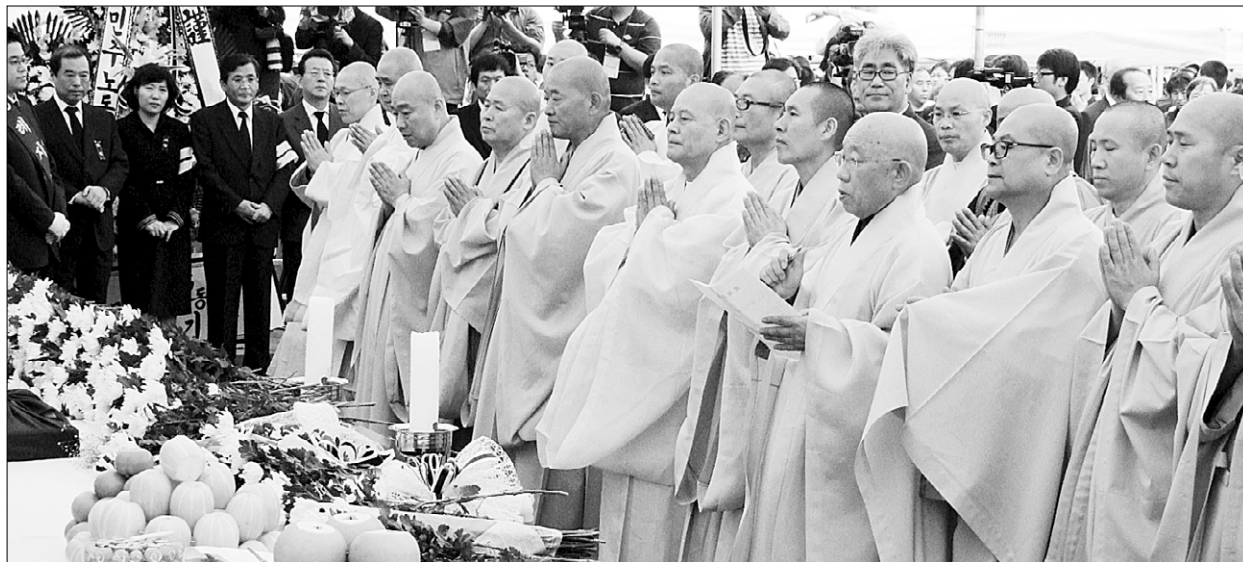
5월 24일 봉하마을에 마련된 노 前 대통령 빈소에서 조문하는 총무원장 지관 스님 등 조계종 집행부 스님들.