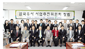
4월 29일 창립된 삼국유사 사업추진위원회.

삼국유사>와 그 집필자인 군위군에 대한 군민들의 자부심이 더욱 고양되는 계기가 될 것"이라며 "<삼국유사>의 고장, 군위군을 대외적으로 널리 알리는데 군민 모두가 동참해 줄 것"을 당부했다.