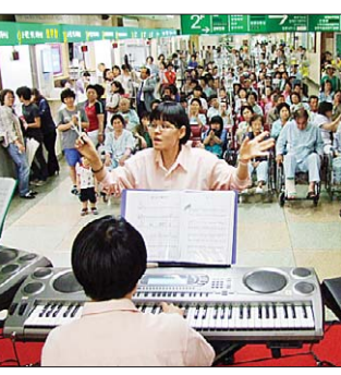
5월 14일 생명나눔실천 부산본부는 부산대학교병원에서 음악회를 열어 환우들을 위로했다. 성주원 합주부가 공연하고 있다.

1부 '함께 나누는 시간'에는 따뜻한 차와 사랑의 떡을 부산대학교병원 전체 병동에 함께 나누며 스님들이 직접 환자들을 방문해 격려의 인