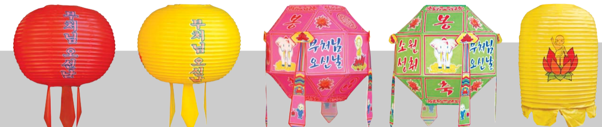
육바리밀 만월등(육바리밀 주름등) 팔각봉축접등 중등