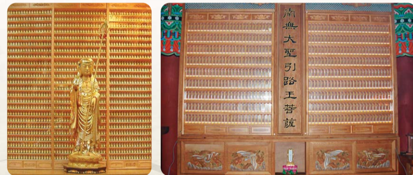
마산 금강정토사 LED인등 천안 동심사 영구위패

찬덕연등에서는 KS케이블을 사용하여 가장 안전하게 전문 기술인에 의해 직접 감독 시공합니다.