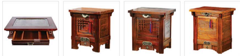
고급 석목 좌탁 수미 판매가 250,000원 50%인 125,000원 전등오른니무탁20kg 판매가 193,000원 50%인 96,500원 전등오른니무탁30kg 판매가 139,000원 50%인 69,500원 전등오른니무탁40kg 판매가 134,300원 50%인 67,150원