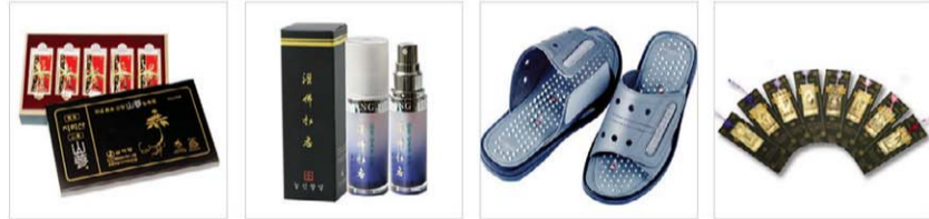
자비사 산악화(산화) 판매가 300,000원 50%인 150,000원 리본수장 판매가 84,500원 50%인 42,250원 지원 건강 슬리퍼 판매가 86,000원 50%인 43,000원 비야노비아 책갈피 판매가 19,200원 50%인 9,600원