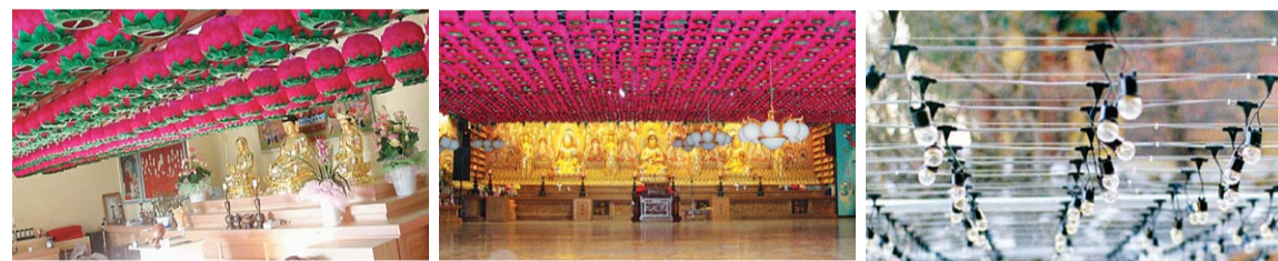
연등 저등 승강장치 _ 대구 장생사 연등 저등 승강장치 _ 서울 화계사 외부에 시공된 전선케이블

찬덕연등에서는 KS케이블을 사용하여 가장 안전하게 전문 기술인에 의해 직접 감독 시공합니다.