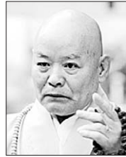
태고종정 혜초 스님.