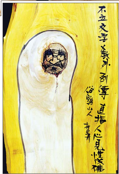
상주 달마선문화예술원에서 정진 중인 범주 스님과 '나무 달마도'.

테두리에도 웃칠을 들여서 완성한다. 범주 스님이 어렵게 장안한 칠선화에 대해 웃 장인들의 평가도 긍정적이다. 한국공예예술가협회 이철룡 회장은 "웃 오름(漆)의 고통을 감내하면서도 오로지 부처님 가르침을 천년 한지에 만년 웃의 토대를 세워 '천년 달마도'인 칠선화를 완성시켜 공개발표 전시회를 갖게 된 것은 독창적인 칠묵화(漆墨畵)를 탄생시킨 것"