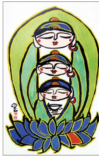
마음의 눈으로 선화를 그리는 수안 스님의 작품.