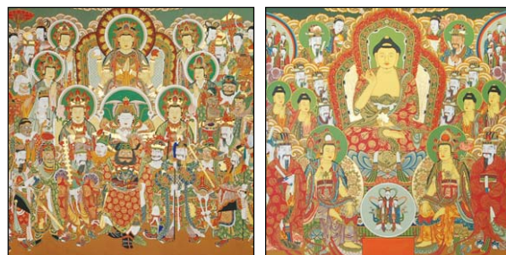
거제도 총영사 신중탱화