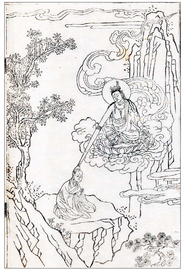
고려시대 판화본인 정토교 개조 자민류(慈愍流)의 개조(開祖)인 혜일(慧日) 스님. 본문의 내용을 차용하여 그려진 정토교의 개조(開祖)인 혜일(慧日) 스님의 정수리를 쓰다듬으며 말씀하셨다. '너는 법을 전수하여 자신도 이롭게 하고 다른 사람도 이롭게 하고자 하고 있다. 서방정토 극락세계는 아미타부처님의 나라이며, 그곳에서는

<석씨원류>에 등장하는 이 삽화는 당나라 스님인 혜일이 천축에서 7일기도를 통해 관세음보살님을 친견하고 가피를 받는 장면을 만화적인 상상력으로 잘 표현하고 있는 작품이다. 혜일(慧日, 680-748)은 중국 당나라 승려로 정토교(淨土敎) 자민류(慈愍流)의 개조(開祖)이며, 의정(義淨) 스님의 영향으로 인도 불적(佛蹟)을 참배하기로 마음먹고 수마트라와 실론(스리랑카)을 거쳐 인도로 들어간 뒤, 719년 18년 만에 장안(西安)으로 돌아왔다. 현종으로 부터 자민삼장(慈愍三藏)이라는 호를 받았으며, 인도에서 터득한 정토교를 열심히 포교하여 정토교 자민류의 개조가 됐다. 저서에 <정토자비집(淨土慈悲集)> <반주삼매찬(般舟三昧讚)> 등이 있다. 본문을 살펴보면 "혜일 스님이 천축에서 많은 학자들이 서방정토를 찬양하는 것을 보고 그 말이 부처님 말씀과 합치되는 것을 깨달아 이 말을 머리에 새기고 건태라국 왕성의 동북쪽에 있는 큰 산에 이르렀다. 그곳에는 관세음보살상이 있었는데, 만약 지성으로 기도하고 청하는 사람은 관세음보살님을 친견할 수 있었다. 혜일 스님은 7일 동안 머리를 조아리고 또한 단식하여 목숨이 다할 때까지 기도를 계속하기를 기억했다. 7일째 되는 날 밤에 이르자 홀연히 관세음보살이 공중에 보였다. 관세음보살은 자금색의 모습으로 보배 연꽃 위에 앉아서 오른손을 드리워 혜일 스님의 정수리를 쓰다듬으며 말씀하셨다. '너는 법을 전수하여 자신도 이롭게 하고 다른 사람도 이롭게 하고자 하고 있다. 서방정토 극락세계는 아미타부처님의 나라이며, 그곳에서는