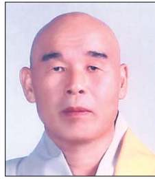
■ (사)대한불교금강종 중정 무학당 승전

인류의 큰 스승이시며 사생의 자부이신 부처님께서 사바세계 중생들의 진정한 삶을 찾아 주시고자 이 땅에 오셨습니다. 우주의 실상이신 석가모니 부처님께서 말씀 없는 가운데에 큰 말씀이 계시듯, 자취 없는 행보에 큰 자취를 보이시듯 사바세계에 오셨습니다. 우리 모두 거룩하신 부처님 오심을 반갑게 경하드립니다. 부처님께서 80세의 생애를 오로지 중생들을 위해서 길에서 태어나서서 길에서 열반하셨습니다. 우리 불자는 한 스승이신 부처님의 제자로서 마음의 문을 활짝 열고 사람을 귀히 여기며 인간으로서 인간다운 참된 삶을 살아가도록 합니다. 우리 모두 말로써 하는 유명무실한 보살행을 하지 말고, 나를 낮추는 하심(下心)의 도리로써 실천 수행하는 대승불살도가 됩니다. 부처님께서 이 땅에 진정으로 오신 것은, "사람을 사람답게 살아가도록 우주의 근본원리인 자비사상을 일러 주시어요 또한 모든 이가 성불하여 불국정토에 태어나게 하십니다." 우리들의 생사일대사(生死一大事)의 서원인 자타일시성불도(自他一時成佛道)를 잊지 맙시다.