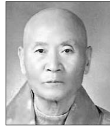
■ 대한불교 자비원종 중정 법성 성공