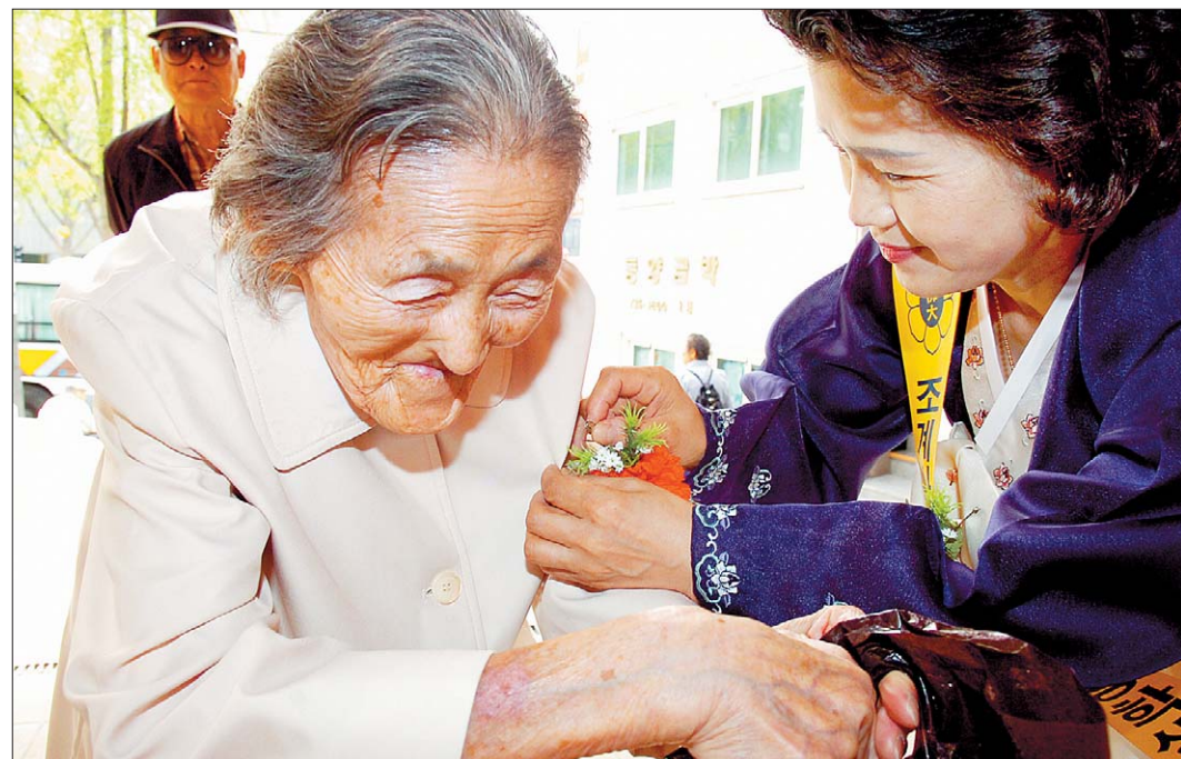
꽃 한 송이에 공경심을 담아... 조계사(주지 세만)는 2009 어버이날 행사로 4월 30일 경내에서 '어르신, 당신은 대한민국의 역사입니다'를 개최했다. 서울노인복지센터(관장 일문) 등과 공동으로 진행한 이날 행사는 젊은 날 국가 발전에 희생을 아끼지 않았던 어르신들께 감사와 공경의 마음을 전하고, 지역사회와 함께 '효'의 의미를 되새기기 위해 마련됐다. 본 행사에 앞서 조계사불교대학 자원봉사자들이 어르신들께 카네이션을 달아 주고 있다.