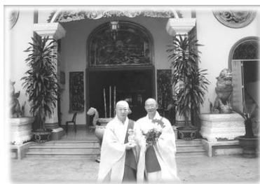
베트남 관음사 사찰과 자매결연