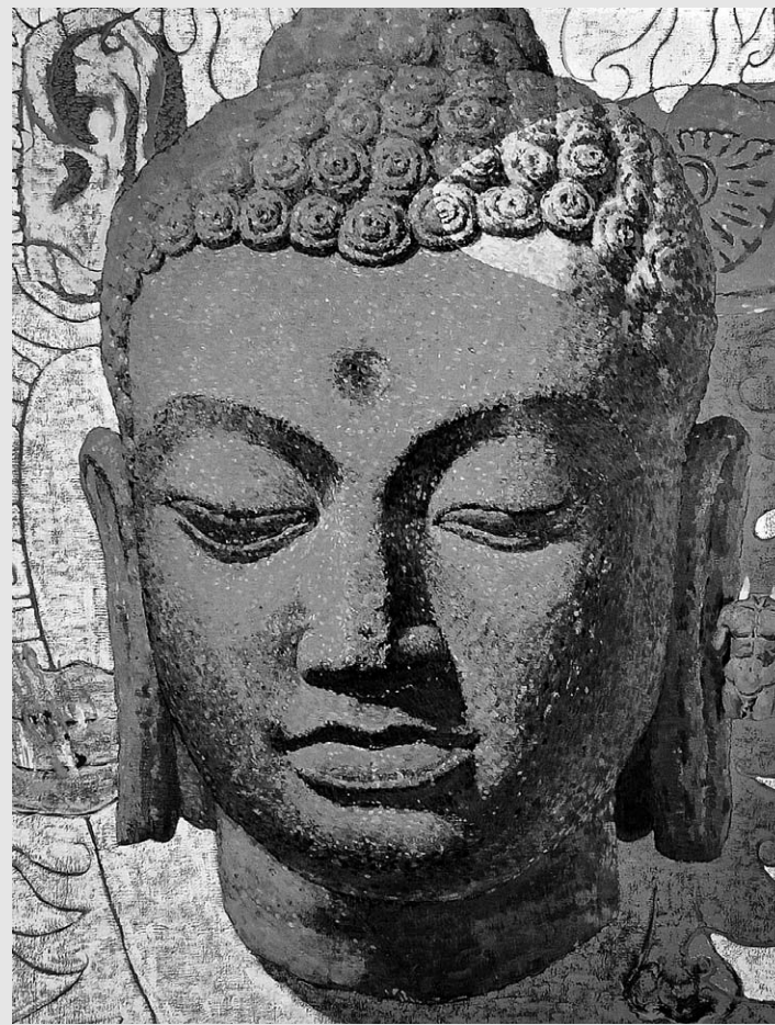
조재익 작 '붓다-불타는 것들' (왼쪽)과 '붓다-꽃이 피다'.

사실 인간은 역사를 떠나 존재할 수 없고, 누구의 삶도 사회의 바깥에서 존재할 수 없다. 고따마 붓다의 삶도 그가 태어난 역사와 사회를 배경으로 펼쳐지고, 그의 삶을 반영하는 가르침 역시 그가 살았던 시대의 정치, 경제, 사회라는 구체적인 상황을 배경으로 한다. 따라서 고따마 붓다의 가르침을 바르게 알려면 그가 살았던 시대의 정치, 경제, 사회가 어떠한 변동기에 있었으며, 고따마 붓다와 교우(交友)했던 이들과 그들이 처한 환경은 어떠한지를 살펴보는 것이 중요하다.