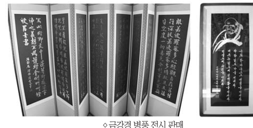
◊금강경 병풍 전사 판매

미륵암 주지 청운 합장 남해군 삼동면 물건리 63번지. (물건리 방조여부림 앞) 계좌번호 : 하나은행 511-910006-06204 / 농협 : 831075-51-023041 (예금주 : 미륵암) 중무소 : (055)867-0776, 2259 / fax (055)867-8009