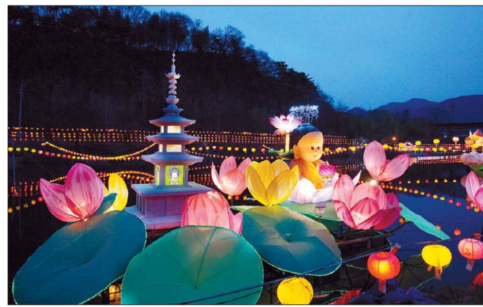
부처님오신날 봉축 제3회 청도 유등제 부처님오신날을 봉축하는 제3회 청도 유등제가 3월 27일부터 닷새 일정으로 막이 올랐다. 청도천 파랑새 다리 부근에서 펼쳐진 유등제는 27일 저녁 범오식과 점등식을 시작으로 행사기간 동안 군민노래자랑과 재즈 공연, 어울림 한마당 등이 이어졌다. 올해 유등제는 청도 소재 유등제기간에 멀리서 돼 많은 관광객들이 몰리며 띄워진 오색 유등을 감상하며 불교문화의 향취를 마음껏 느꼈다. 손법천 대구지사장

와 다량의 구슬, 성분 미상의 사리 12과(顆)가 수습됐다. 이에 스님들은 진신사리를 모시고 공양의식을 봉행했다. 이번회 행정관(조계종 문화부)은 "이번에 출현된 미륵사지석탑의 진신사리는 1300년 전 백제인의 신앙의 결정체"라며 "조계종은 문화재청과 협의해 불자들을 비롯한 모든 국민들이 진신사리를 친견할 수 있도록 사리친견법회를 봉행할 예정"이라고 말했다. 한편, 높이 5.9cm·어깨 폭 2.6cm의 사리내호는 전반적으로 외호(높이 13cm·어깨 폭 7.7cm)와 유사한 모습을 띠고 있었으나 뚜껑과 동체 상부가 일체형(一體形)으로 제작된 것으로 조사됐다. 조동섭·김진성 기자