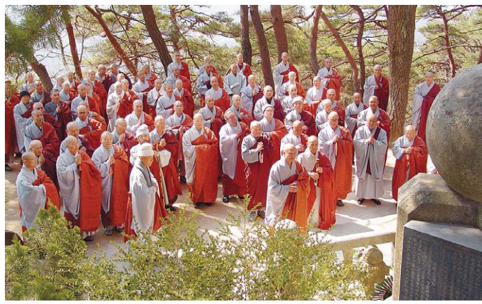
4월 2일 수덕사 정혜사에서 봉행된 '만공 선사 탄신 138주년 대례'에서 스님들이 만공선사 부도탑을 참배하고 있다.