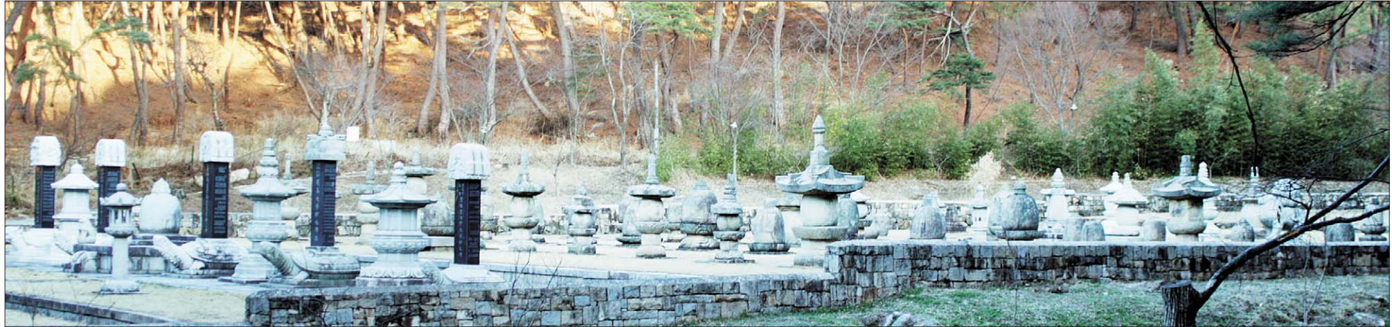
통도사 부도밭 전경.