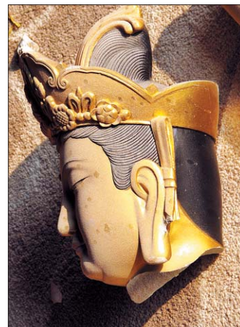
용역 직원의 무단 철거 과정에서 훼손된 관음보살상의 모습.