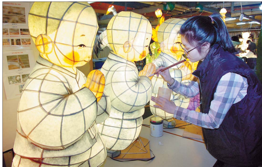
부처님오신날과 연등축제를 앞두고 사찰마다 연등과 장엄등 제작에 여념이 없다. 사진은 한마음선원 청년회원이 박재원 기자의 촬영 등에 채색을 하는 모습.