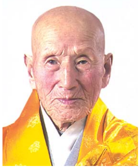
실천함을 목표로 한다.

아울러 대승불교(大乘佛敎)의 핵심사상인 성불도성을 스스로가 실천하고 지혜와 자비정신