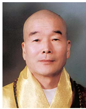
현실적인 체험이며 자신의 내부에 깊숙이 숨어 있는 본성(本性), 진아(眞我)를 표현해 현재의식

으로 풀어 올려 눈 앞에 보일 때에 비로소 각자(覺者)로서 당당하게 외칠 수 있는 것이다. 이 위없는(無上) 존귀한 자아의 존재를 우리는 우선 믿고 나아가야 한다. 이것을 믿고 나서