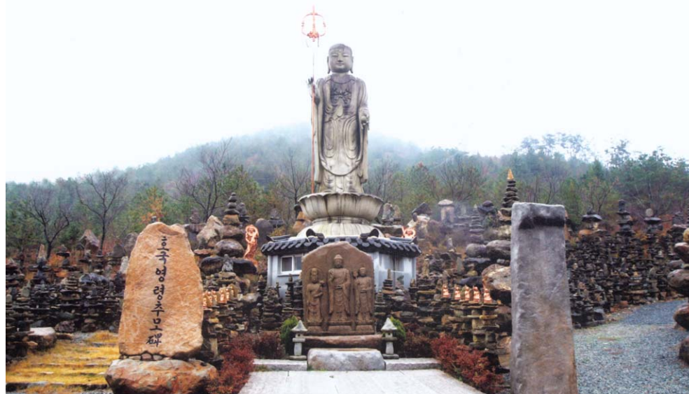
움천사 지장 대불

△ 조·중·교생 장학사업, △ 종립학교 설립, 해외연수 교육 연1회 실시, △ 독거노인 요양원 설립, △ 교도소 수용자 교화사업, △ 승려전통의식 및 수련원 설립, △ 사이버 법당 운영과 영불선원을 적극 활용하여 부처님의 교리를 삶의 가치기준으로 삼아 생활불교로서 전법도생 대중교화의 전 종도들이 적극 동참하여 자리가 타 정신을 구현코자 한다.