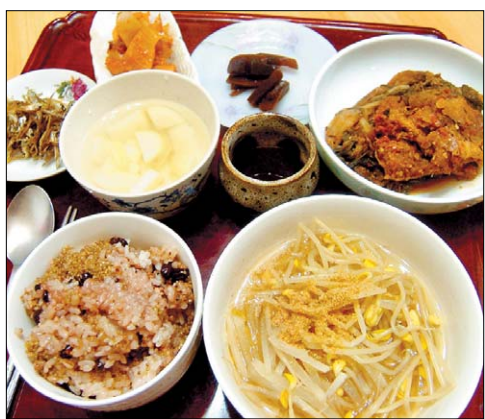
'인연'과 함께한 무량화할머니표 무궁해 밥상.

무량화할때와 눈이 맞은 건 경주 성건동 어느 허름한 골목에서다. 꽃분홍 스웨터를 걸친 할매는 골목머리에서 서성대고 있었다. "방 구하노? 내가 보여주꾸마?" 다소 거친듯하면서도 포방포방한 할매의 사투리가 춘삼월의 봄벌처럼 서늘한 마음을 따사롭게 흘러들었다. 한 마디를 던지고는 뻗어 바라보는 할매의 눈이 말없이 깜빡이며 천진스럽게 재촉한다. 사정이 생겨 당분간 경주와 서울을 오가는 '이중생활'을 하게 됐다. 한적하면서도 공기 좋은 동네에 방을 얻을 계획에 이 골목 저 골목을 서성이다 만난 무량화할매와의 인연은 그렇게 시작됐다.