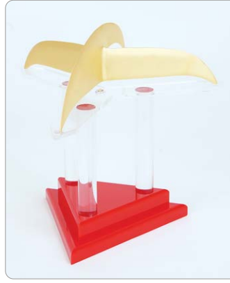
의정등록번호 제 2008-0052952호 크기 : 높이 87cm×폭 26cm

지금 이 시대는 과거도 지나고 현재도 지나고 미래의 시대입니다. 자신이 느끼지 않더라도 절대로 믿지 못하고 몸으로 느껴야 믿는 지금의 현실입니다. 이 불멸조(不滅鳥)는 가정, 사업장, 자동차 등 육해공(陸海空)을 움직이며 다니는 모든 곳에 두시면 갑자기 일어나는 사고와 재해(災害)를 예방하고 요즘 많이 떠다니는 영혼들의 액운(厄運), 액살(緣殺), 잡귀(雜鬼) 등의 조화 부림으로부터 해방될 뿐 아니라 이로 인하여 가정에는 행복(幸福)과 건강(健康)과 부부금슬(夫婦琴瑟)이 좋아지고 자녀(子女)들의 앞길에 걸림돌이 없어지며 사업장에는 사업번창(社業繁昌)이 자동차나 움직이는 곳에는 안전과 사고예방을 하는 힘(力)과 원력(原力)으로 지켜주는 미래(지금)의 꼭 필요한 불멸조(不滅鳥)입니다. 불멸조(不滅鳥)는 태양(太陽)속에 사는 삼족조(三足鳥)의 원력(原