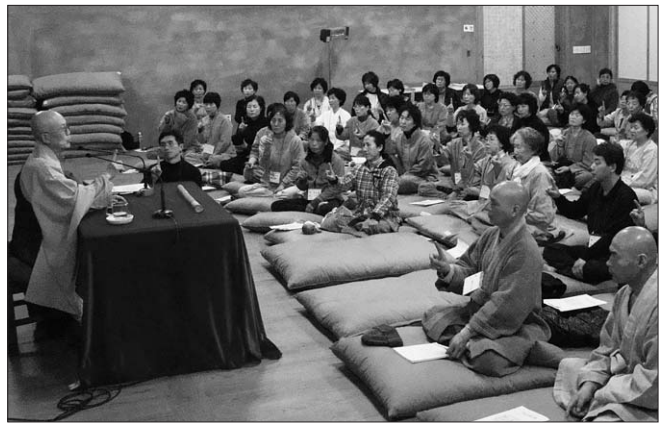
안성 활인선원에서 열린 '참선대중화를 위한 정진대법회'에 70여 사부대중이 참가해 큰 호응을 얻었다.