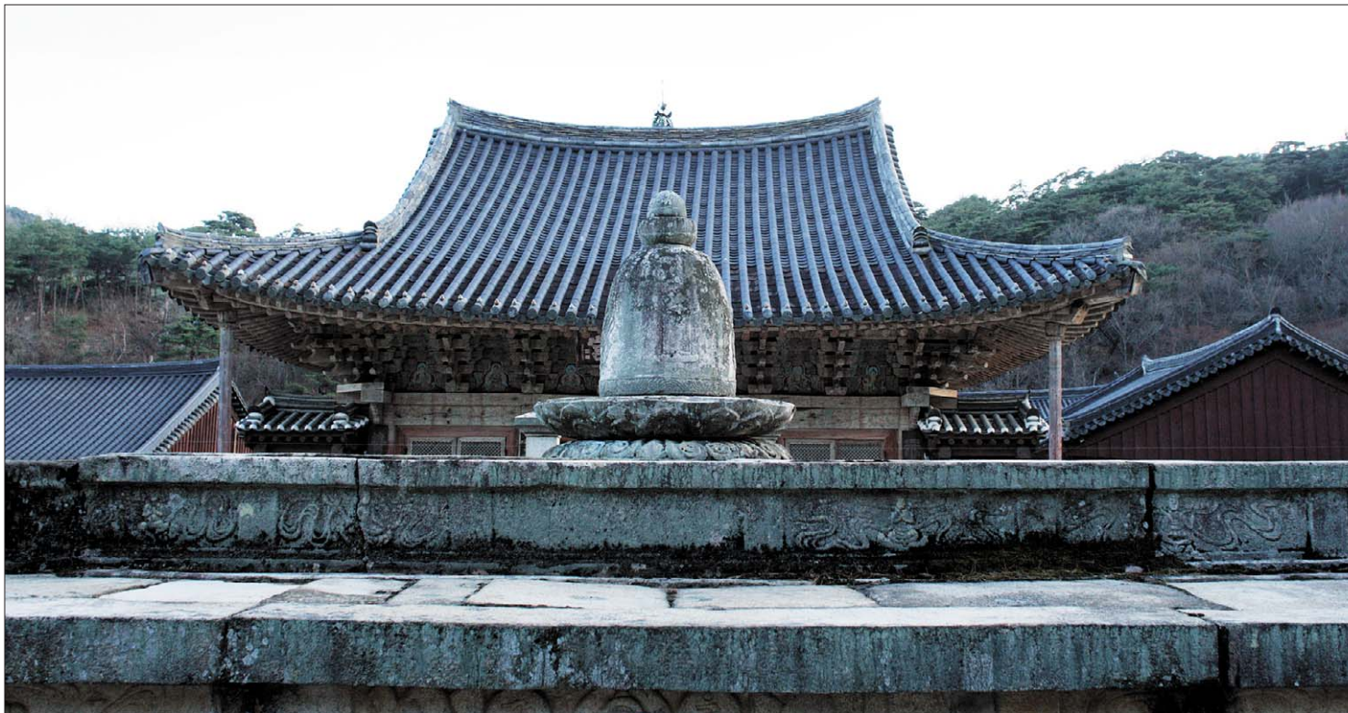
신라 자장 율사가 통도사를 창건할 때 쌓았다는 금강계단. 현재의 모습은 18세기에 중수된 것으로 추정된다.

거대한 불탑을 조성하기 위해서는 재물과 권력 노동력 등을 가진 많은 사람들의 참여가 필요했으므로 불탑 하나가 세워지기까지는 건립의 주재자를 중심으로 많은 대중의 율력과 시주가 필요했을 겁니다.