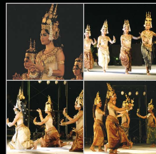
압사라 댄스 민속무용 12가지의 무용(공연 총 소요시간_90분)

기간_2009년 4월 15일~7월 15일(90일간) 초청_한국국제문화교류협회/도우 (www.108.or.kr)