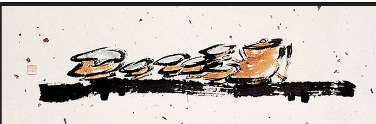
법관 스님의 선화.