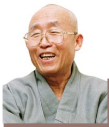
월운 스님에게 듣는 경전이야기 <16>