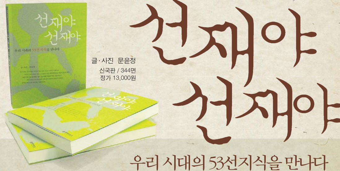
글·사진 문윤정 신국판 / 344면 정가 13,000원