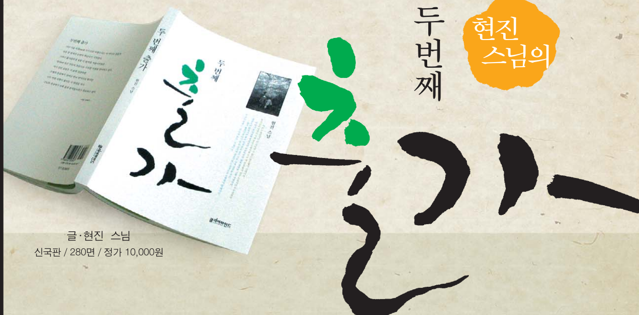
글·현진 스님 신국판 / 280면 / 정가 10,000원

12년 전에 출판되어 많은 사랑을 받은 현진 스님의 수행 에세이 <두 번째 출가>는 초판의 내용을 조금 첨삭하고 사진을 바꾸는 등 멋스러움을 가미하여 개정판을 내놓았다. 현진 스님은 그야말로 '글꾼'이라고 할 수 있다. 책을 만들기 위한 글쓰기가 아니라 글을 쓰다 보니 책으로 엮이게 되고 이러한 책을 읽는 이들은 감시의 멈춤도 없이 한숨에 다 읽어버리는 재미를 느끼게 되니 진정한 이 시대의 글꾼이 아니겠는가?