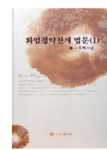
화엄경약찬게 법문(1) 우학스님 지음 | 좋은인연 펴냄 1만원

<화엄경>은 방대하다. 10조9만5천48자로 이루어진 경전이라고 한다. 부처님이 정각을 이룬 뒤 첫 법문이기도 하다. 이 방대한 법문을 7자로 된 110구로 축약한 것이 '화엄경약찬게'다. 용수보살이 지었다는 설과 그의 감수아래 지어진 것이란 설이 있다.