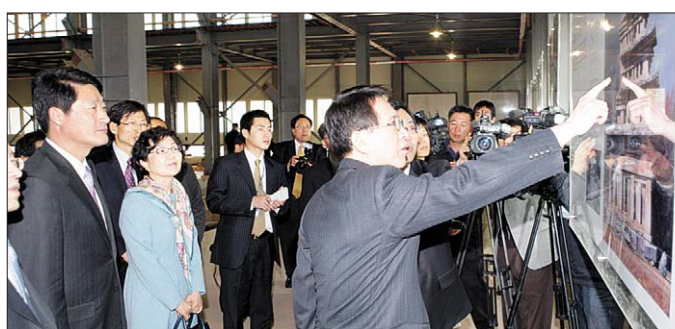
김형오 국회의장(가운데)이 이한수 익산시장(왼쪽 두 번째) 등과 미륵사지석탑 발굴현장을 둘러보고 있다.

한편, 전라북도(도지사 김완주)는 3월 23일 '전라북도 백제문화유산 보존 추진위원회(이하 위원회)'를 발족했다. 위원회는 고문 6명과 3개분과 추