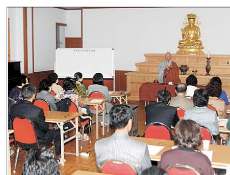
3월 18일 광주사암연합회 불교회관에서 열린 <금강경> 강좌. 매주 수요일에 열리는 강좌는 4개월간 이어진다.

광주지역의 대표적 불교단체인 (사)광주불교사암연합회(회장 장성오)는 3월 18일 사암연합회 불교회관 2층에서 광주지역 불교신행단체를 대상으로 <금강경> 강좌를 개최했다.