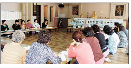
나주 심향사가 마련한 '불자 열린 대화의 장'에서 참석자들이 토론하고 있다.