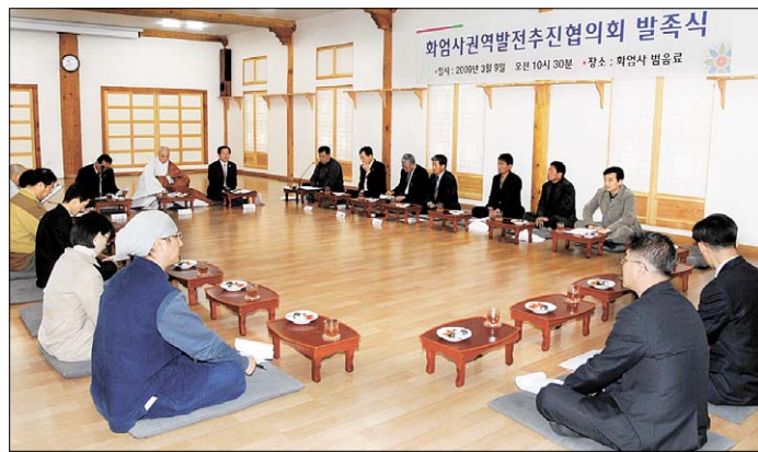
구례 화엄사는 3월 9일 화엄사에서 전남도, 구례군 등 지역 관계자들로 구성된 화엄사권역발전추진협의회를 발족시켰다.

참가자들은 관광객 감소 원인을 일반인들의 관광패턴 변화와 관광 상품 개발 미비, 진입도로와 주변환경 개선 부족, 인근 상가의 노후화 등을 주원인으로 꼽았다.