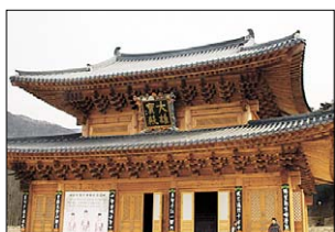
불사 4년만에 원형 복원된 월출산 도감사 대응보전.

불사 4년만에 복원된 대응보전은 외부 중층 내부 통층, 은칸 물림 방식의 74평 규모로 조선 초기 대표적 팔작지붕에 막새기와를 얹어 현대와 조화를 이룬 전통양식이다. 대응보전에 모셔진 삼존불은 10m 규모, 후불탱화는 높이 6m, 길이 11m 크기다.