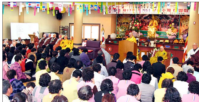
한국불교미륵종이 창종 제17주년을 맞아 3월 8일 관음정사에서 창종 기념식을 봉행했다.

한국불교미륵종은 창종 제17주년을 맞아 3월 8일 오전 10시 경남 김해시 진례면 미륵종 총본산 관음정사 승려 교육장에서 창종 기념식 및 보살계 산림수레법회를 봉행했다.