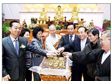
10주년을 맞은 법륜회가 축하 떡을 자르며 자축하고 있다.