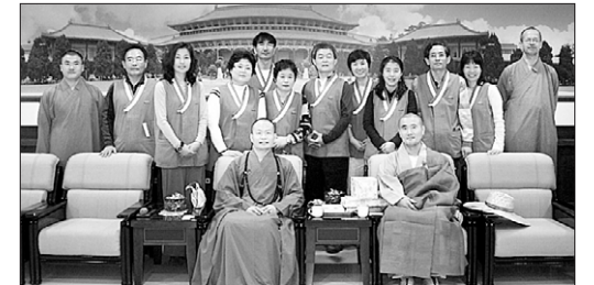
(사)파라미타청년연합회(회장 도환)는 2월 18~21일 제3회 파라미타 우수지도자 해외연수를 실시했다. 단장 부령 스님 외 10명은 대만 중대신사, 불광산사, 지체공덕회, 지형사에서 해외 불교문화를 체험했다. 이상연 기자