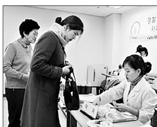
성북장애인복지관과 경찰병원은 자매결연을 맺고 2011년까지 무료진료서비스를 제공한다.

의료 혜택의 사각지대에 놓이기 쉬운 장애인들이 보다 높은 수준의 의료 서비스를 지속적으로 받을 수 있게 될 전망이다.