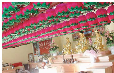
연등 저등 승강장치 _ 대구 장성사

▶ 전선(케이블)연등승강장치 天上列車 ※ 원하시는 사찰 규격에 맞추어 직접 제작 · 시공해 드립니다.