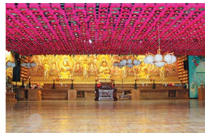
연등 저등 승강장치 _ 서울 회계사