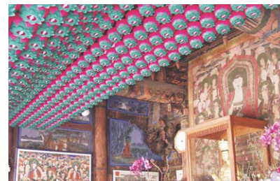
대구 파계사 원통전 천장 전기공사 및 연등 시공