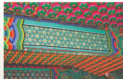
연등 설치 후