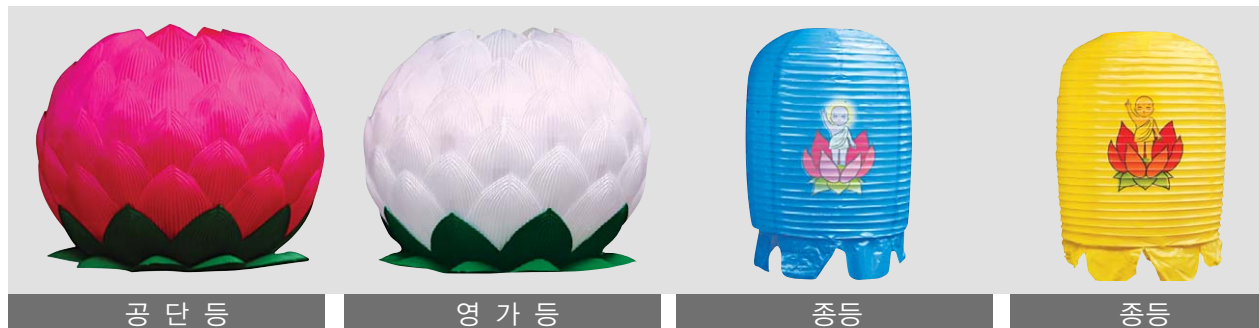
공 단 등