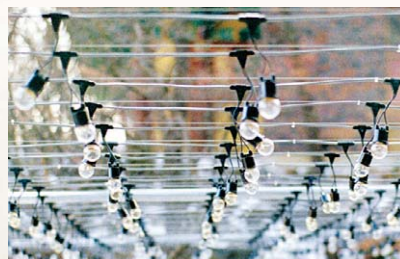
외부에 시공된 전선(케이블)