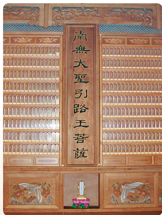
천안 동심사 영구위패

찬덕연등에서는 KS케이블을 사용하여 가장 안전하게 전문 기술인에 의해 직접 감독 시공합니다.