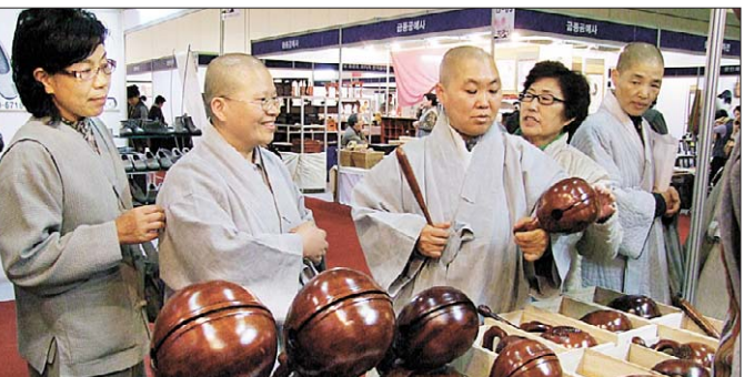
2008 불교문화엑스포 팔관회 전시관에서 스님들이 목욕을 둘러보고 있다.

부산불교연은 “2008년 제1회 불교문화엑스포 팔관회의 경험을 밑거름으로 삼아, 올해부터 봄에 불교산업박람회, 가을에는 불교문화박