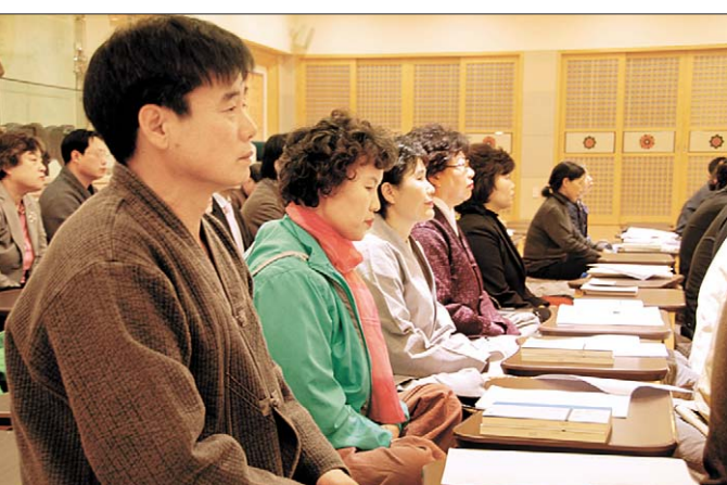
부산불교인재개발원 로터스불교대학의 수업 모습.

망미동 영주암불교대학 (학장 정관, 051-754-2210)은 전문과정(불